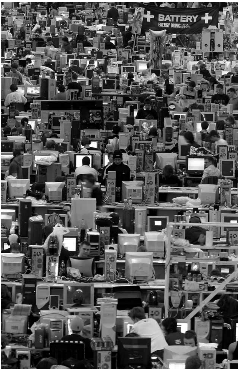
Секоја година 5000 луѓе се собираат на најголемиот светски компјутерски собир во Хамар, Норвешка