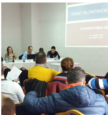
Општа информативна сесија во Струга

ПГУ и понатаму ќе продолжи со организирање на информативните сесии, со цел да допре до што повеќе заедници во Македонија.