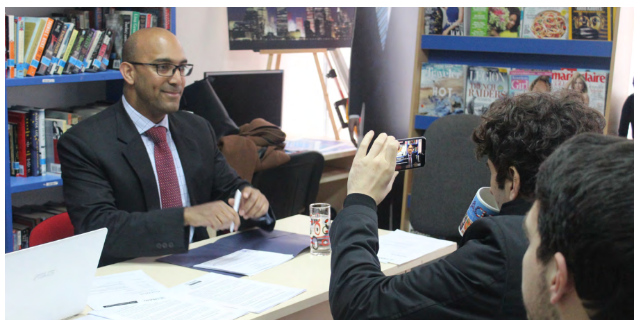
Пренос во живо на фејсбук профилот на УСАИД од Информативната сесија на ПГУ во Американско катче во Штип