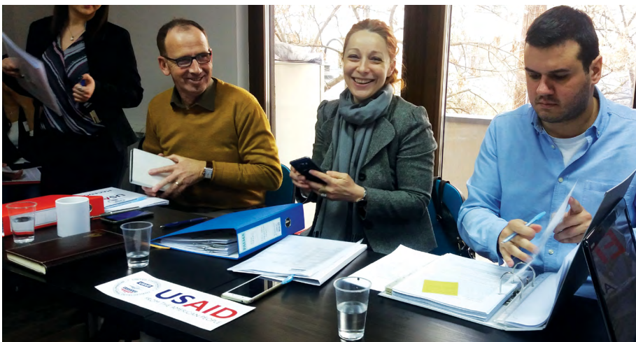
Членови на комисијата за разгледување на грантовите (КРГ) од ПГУ

во решавање на приоритетните потреби на ниво на заедницата, но исто така и за преземање на иницијативи за застапување кои вклучуваат интеракција со институциите на централната власт. На крајот од настанот, ПГУ ги покани ГО кои ги презентираа најефективните и најкреативните проектни идеи, да поднесат целосна апликација до ПГУ до крајот на март 2017 год. ПГУ планира да додели грантови на најдобрите апликанти во текот на следниот квартал.