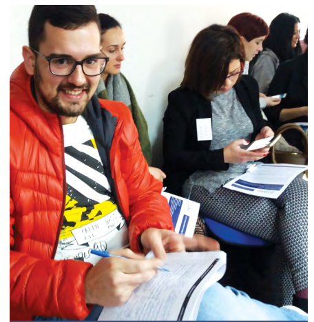
Претставници на младински ГО се регистрираат за настанот за натпревар на идеи

“Ова за мене претставува можност за животна промена – да бидам во можност да придонесам за мојата заедница” кажа претставник на една од младинските ГО што учествуваше на настанот за натпревар на идеи на ПГУ.