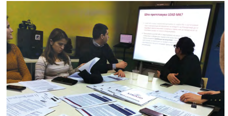
LEAD МК информативна сесија во Американско катче, Струга

ИВМИ е независна и непрофитна организација со седиште во Њу Јорк, која работи на зајакнување на демократските општества преку поврзување на владата, граѓанското општество и приватниот сектор со цел да се изградат отчетни, подготвени и транспарентни институции кои се во служба на најдобрите интереси на луѓето.