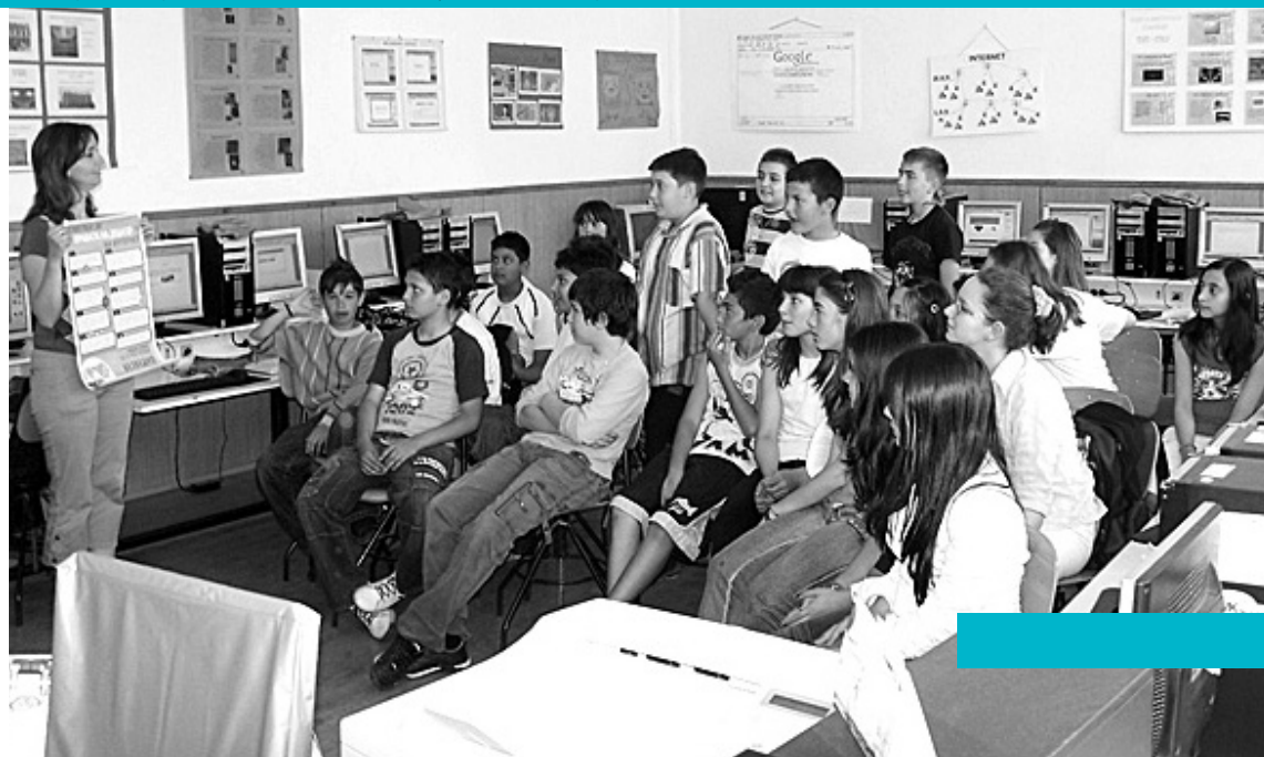
Fotografi nga edukimet për shfrytëzim të sigurt të internetit në Ohër

Më tepër për rolin tuaj në mbrojtjen e fëmijëve gjersa përdorin internet në shkollë, për rregullat që duhet t'i keni parasysh në përputhje me moshën e tyre, si dhe ide dhe resurse që mund t'i përdorni në procesin arsimor do të gjeni në: http://www.bezbednonainternet.org.mk/nastavnici .