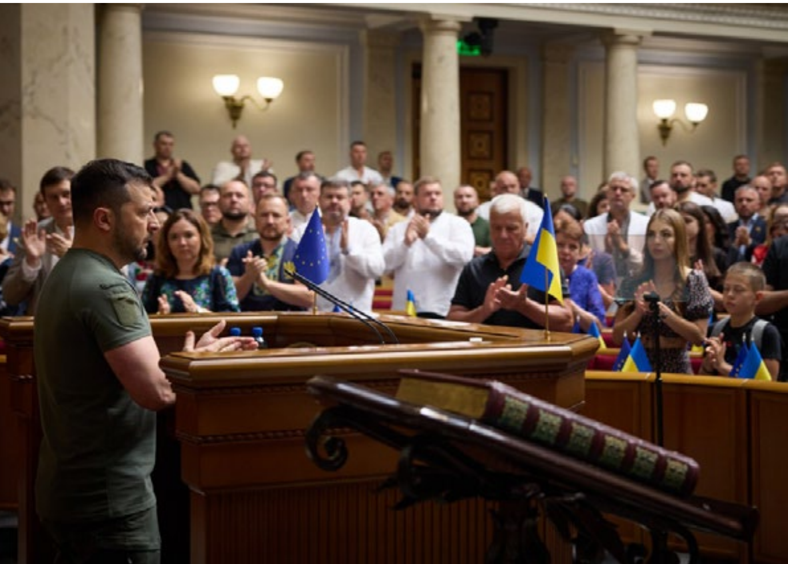
Володимир Зеленски во обраќање пред Врховната рада по повод Денот на Уставот на Украина - 28 јуни 2023 г.

Патријархот Кирил отворено ја поддржува воената инвазија на Русија врз Украина. Како што веќе пишувавме, Зеленски ја брани Украина од руска пропаганда во црквите.