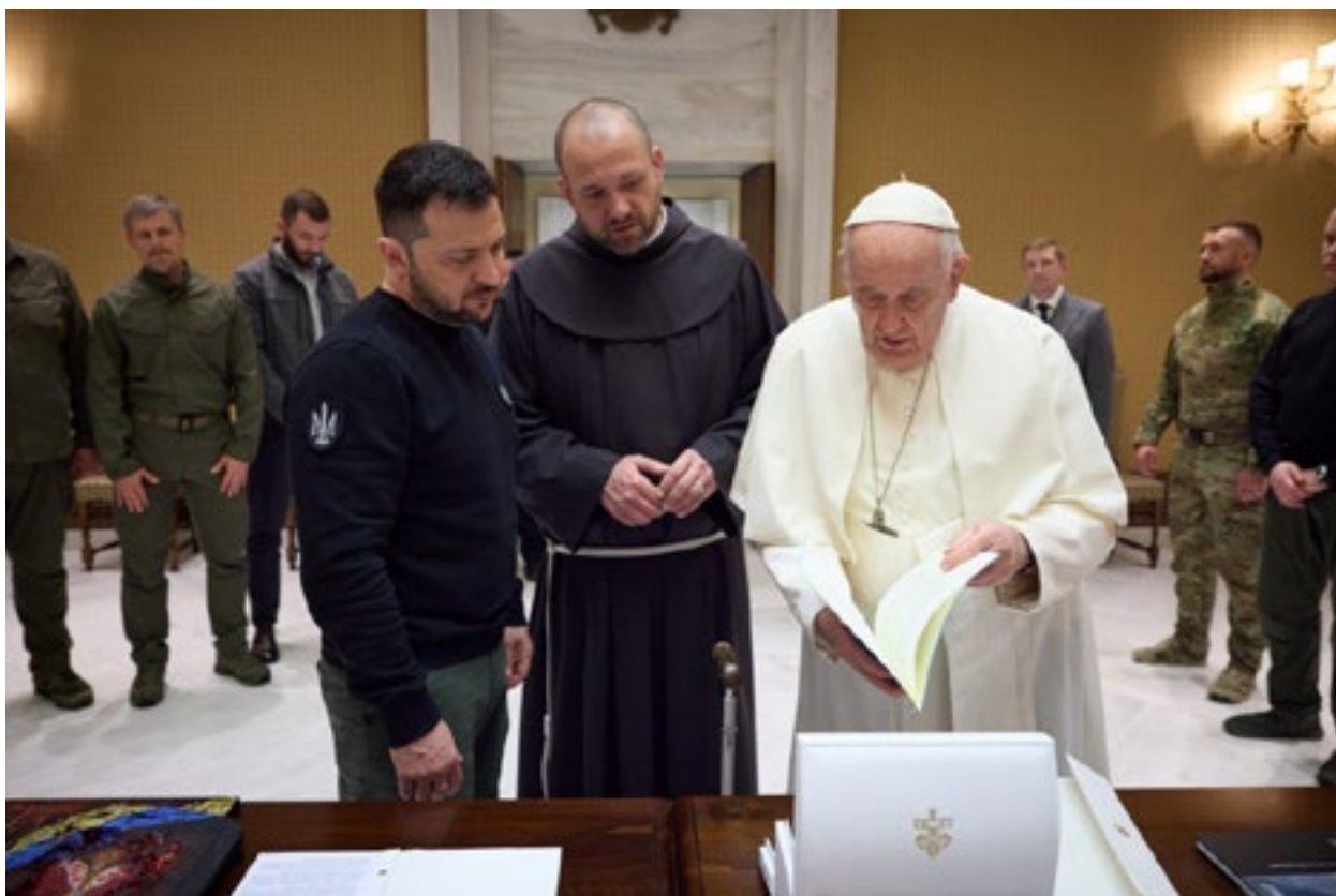
Володимир Зеленски при посетата на Ватикан и Италија се сретна со Папата Франциск, 13 мај 2023 г.