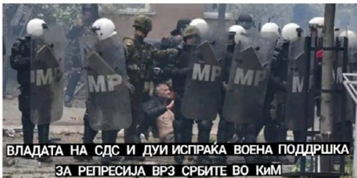
Фото: Скриншот од дел од реакцијата објавена во Антропол и други медиуми