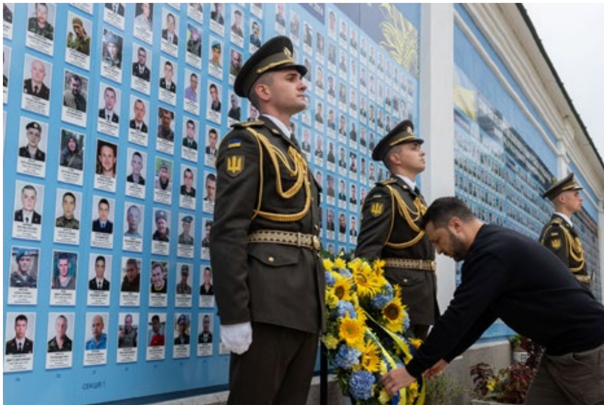
Зеленски положува свежо цвеќе пред спомен обележјето на загинатите борци во војната со Русија при одбележувањето на Денот на бранителите на Украина, 01 октомври 2023 г.

Украинскиот претседател е врзивното ткиво кое ги обединува сите напори на земјата за одбрана против руската агресија и тоа на сите фронтови. Зеленски е најзаслужен за високиот морал на украинските оружени сили, за дипломатската, воената и финансиската поддршка која Украина ја ужива и добива од целиот демократски свет и за поддршката која неговата политика ја добива од граѓаните на Украина. Напорите на земјата за одбрана од агресијата ќе изгледаа сосема поинаку ако на челото на земјата не беше лидер каков што е Зеленски. Токму затоа Кремљ ќе продолжи да прави сè што е во негова моќ да го наруши, па и да го уништи неговиот кредибилитет, а со тоа и да ја намали и минимизира меѓународната поддршка за Украина. И тоа особено ако состојбата на фронтот продолжи да не се развива во корист на Кремљ.