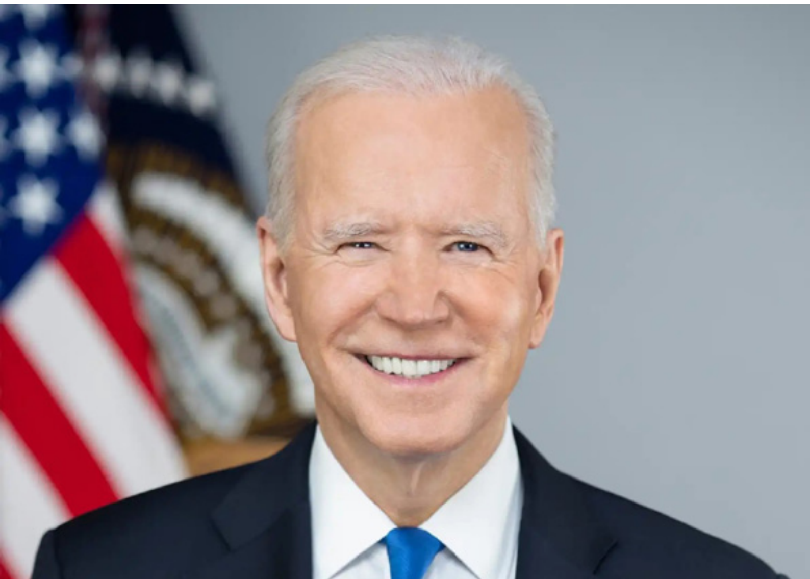
Portreti zyrtar i presidentit Xho Bajden