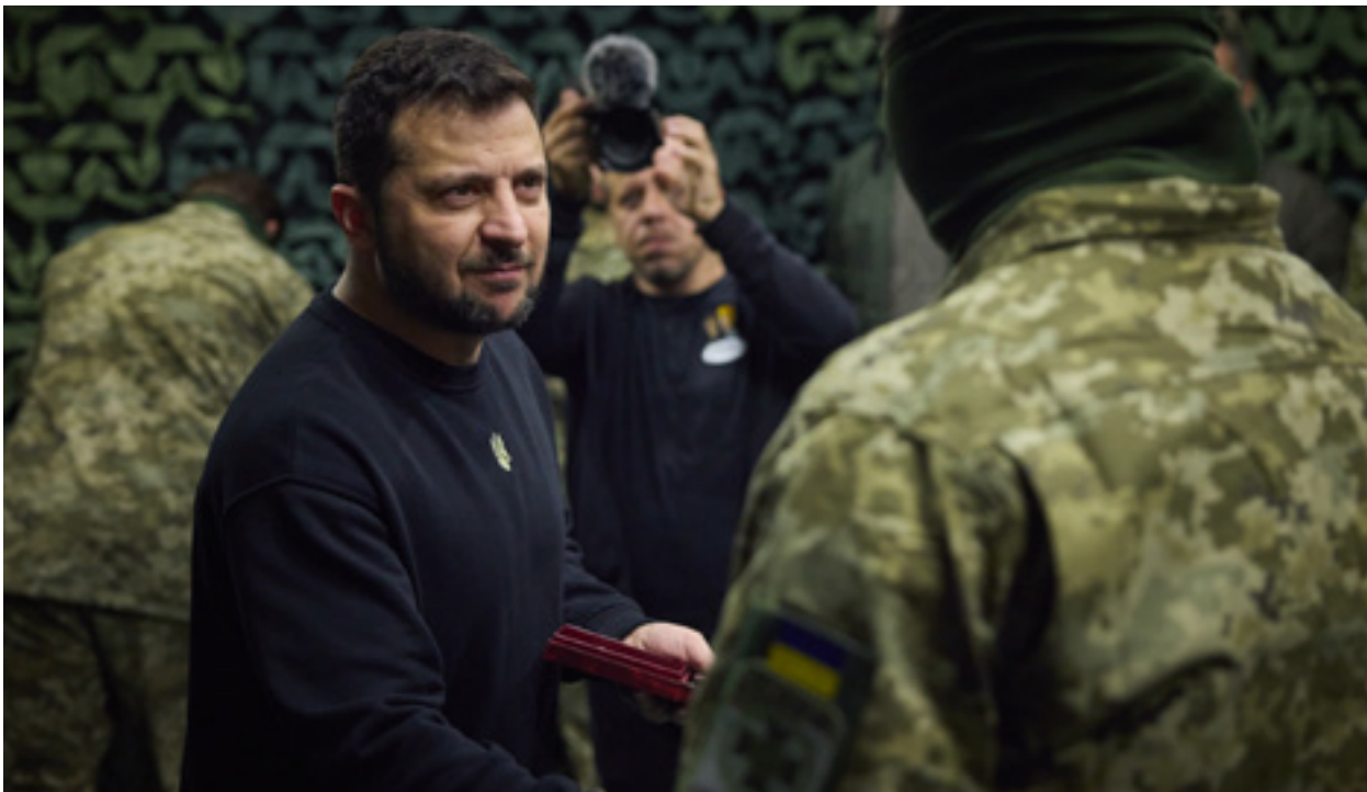
Volodimir Zelenski gjatë vizitës së tij në rajonet Kherson dhe Mykolaiv, 20 tetor 2023.

Instituti i Komunikimeve Masive raportoi se propagandistët po pretendojnë në mënyrë të rreme se video e fjalimit të Zelenski është redaktuar në transmetimin e drejtpërdrejtë në mediat ukrainase. Për të gjitha faktet e mësipërme, ne e vlerësojmë postimin që po shqyrtojmë si të pavërtetë.