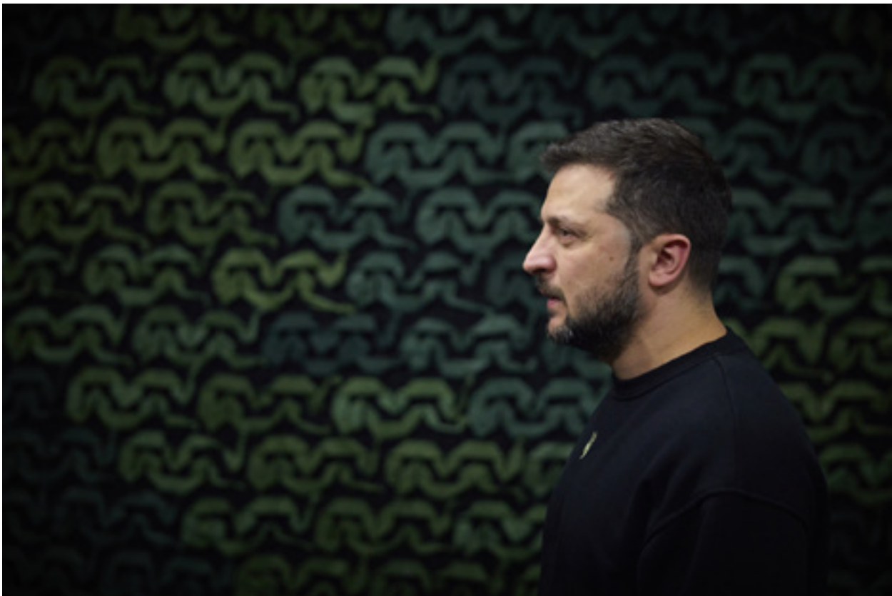
Foto: Zelenski objektivi më i rëndësishëm i dezinformimit të Kremlinit Volodimir Zelenski gjatë vizitës të rajoneve Kherson dhe Mykolaiv, 20 tetor 2023.

E dhe në fillim të pushtimit rus të Ukrainës, autoritetet në Kremlin besonin se do të ishte gati për tre ditë dhe se Kievi do të binte, nëse jo ditën e parë, atëherë sigurisht në ditën e dytë. Sipas një plani të tillë, trupat “elitare” të liderit çeçen, Ramzan Kadyrov, përndryshe pjesë e Gardës Kombëtare Ruse, së bashku me trupat e tjera ruse hynë në Ukrainë nga veriu, përmes Bjellorusisë, me shpresën për të kapur kryeqytetin ukrainas përmes një “Blitzkrieg”. Por trupat çeçene, përveç kapjes së Kievit, kishin një detyrë tjetër të caktuar nga bosët e tyre në Kremlin - të gjenin dhe vrisnin presidentin ukrainas Volodimir Zelenski. Një plan i tillë, siç dihet, dështoi. Jo vetëm që Zelenski nuk u vra, por as Kievi nuk u kap. Dhe për më tepër, në fillim të marsit 2022, autoritetet ushtarake ukrainase raportuan se njësi “elitare” çeçene e ngarkuar me vrasjen e Zelenskit ishte, në fakt, u shkatërrua nga forcat e armatosura të Ukrainës , siç u shkatërruan një numër i njësiteve ushtarake elitare dhe me përvojë ruse gjatë sulmi i dështuar në dimër dhe në pranverë.