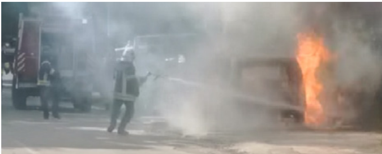
Djegie e veturave në Zveçan.

Në të njëjtën deklaratë thuhet se NATO vendosi të dërgojë një numër të shtuar të anëtarëve të saj në të katër komunat pasi kryetarët shqiptarë hynë në godinat e komunës, si masë parandaluese kundër dhunës dhe për të mbrojtur jetët e të dyja palëve, por se “ata u sulmuan nga një turmë agresive që vazhdimisht shtohet. KFOR-i gjithmonë punon me vendosmëri dhe përmbajtje, brenda rregullave strikte të angazhimit. Në këtë rast, KFOR-i iu përgjigj sulmeve të paprovokuara nga një turmë e dhunshme dhe e rrezikshme gjatë kryerjes së mandatit të OKB-së në mënyrë të paanshme”, thuhet në komunikatën e Komandës së KFOR-it.