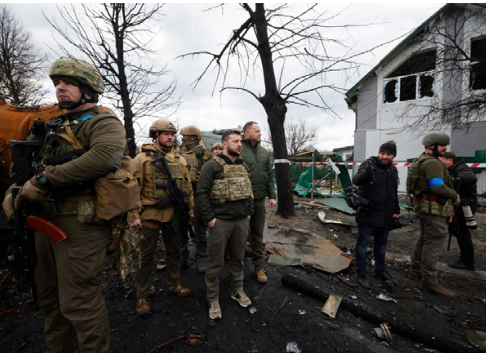
Foto: Presidenti ukrainas Volodimir Zelenski gjatë vizitë në fushën e betejës afër rajonit të Kievit.