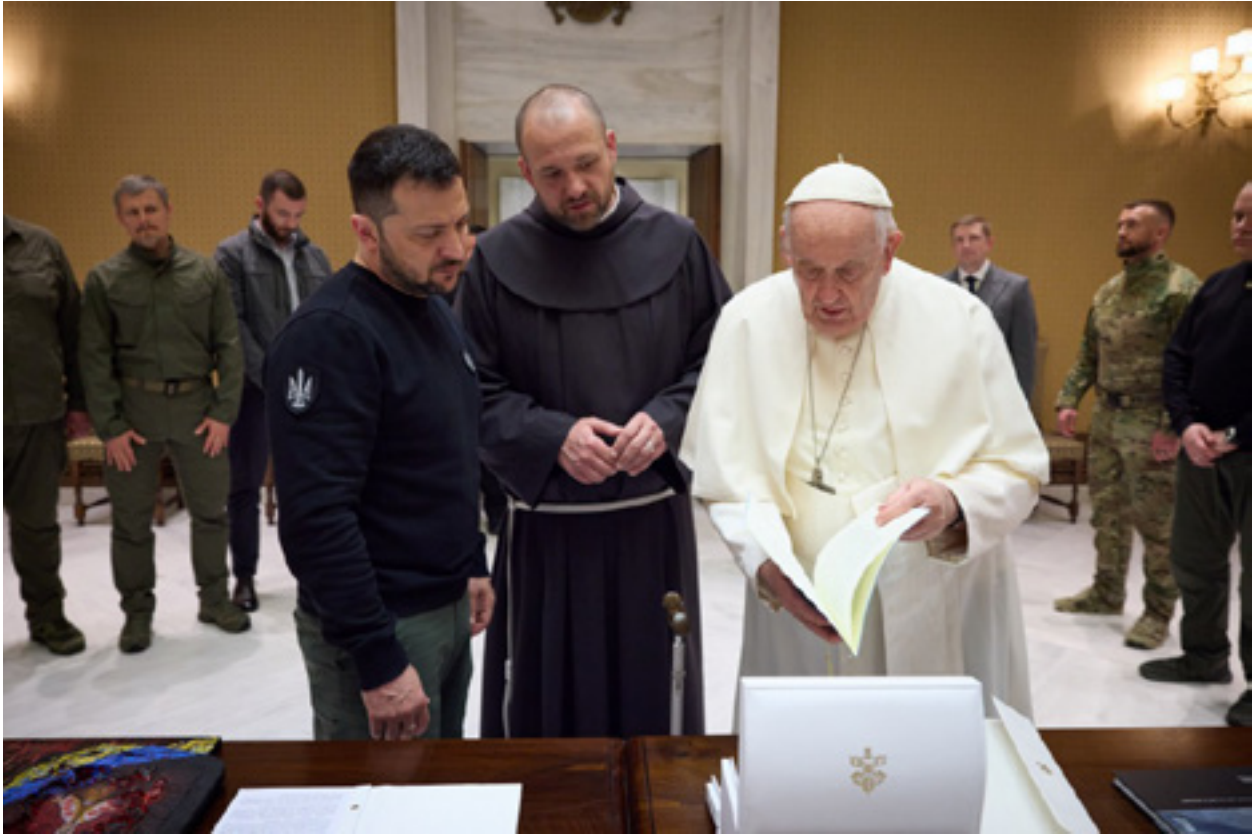
Volodimir Zelenski gjatë vizitës së tij në Vatikan dhe Itali takoi Papa Françeskun, më 13 maj 2023