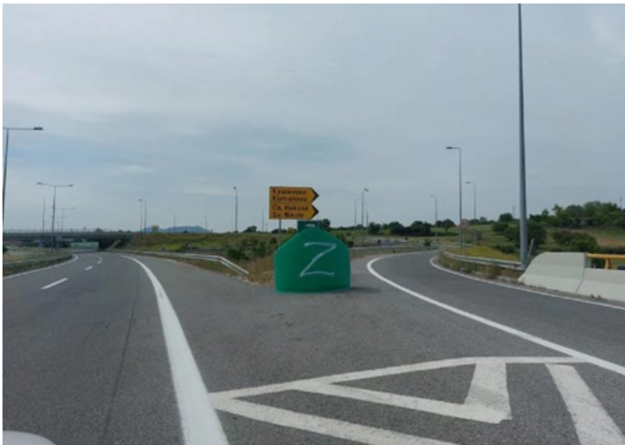
Simboli i pushtimit rus të Ukrainës i shkruar në tabela në autostradën Miladinovci-Shtip

Meta.mk para disa ditësh e ka vërejtur aktin vandalizëm, i cili përveç përhapjes së propagandës së huaj në vend në mënyrë shumë të lirë, paraqet rrezik real për sigurinë në komunikacion, sepse shenjat e komunikacionit duhet të shërbejnë për informimin e drejtuesve të mjeteve që drejtojnë automjetin e tyre.