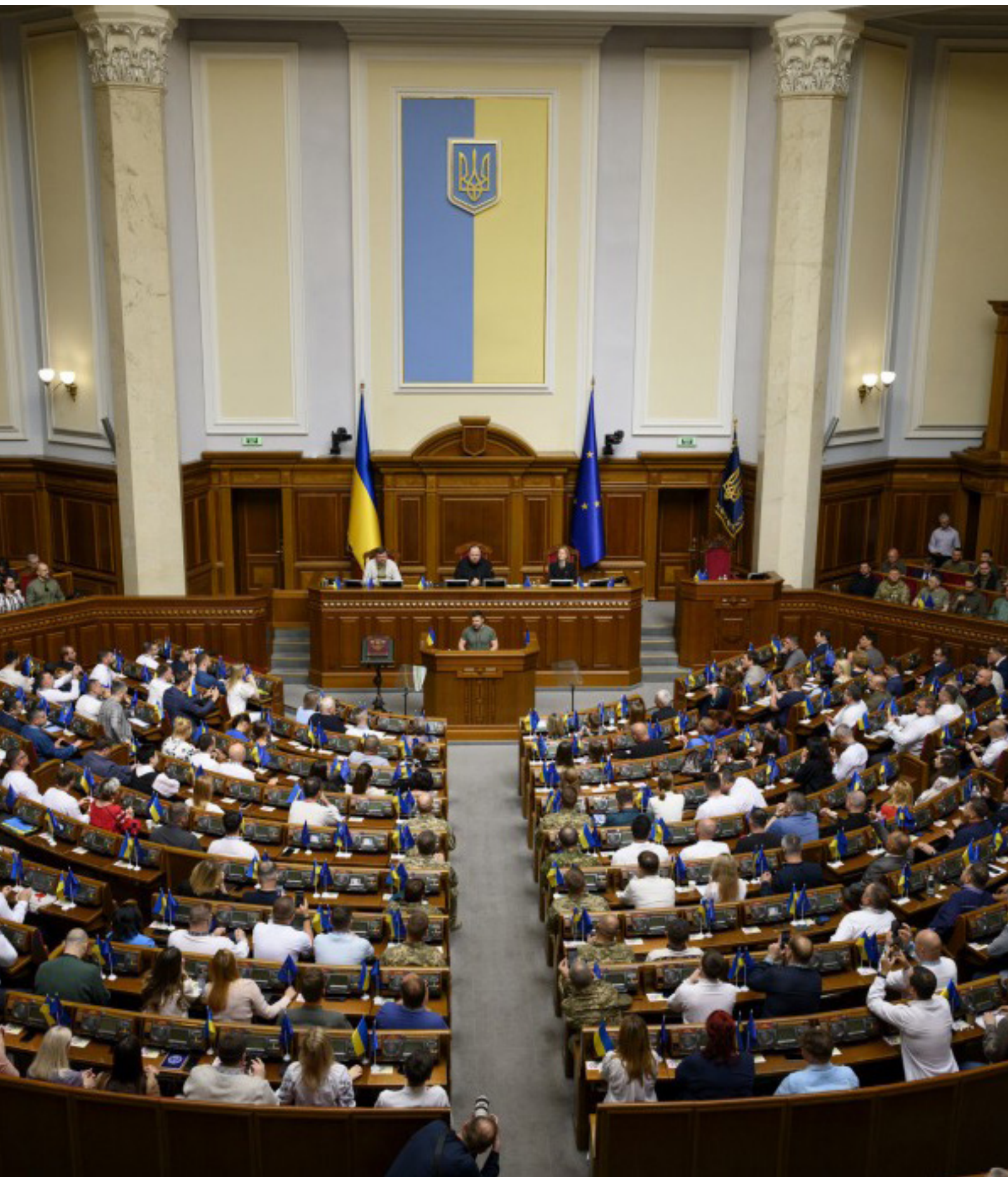
Volodimir Zelenski duke iu drejtuar „Radës së Lartë“ me rastin e Ditës së Kushtetutës së Ukrainës - 28 qershor 2023