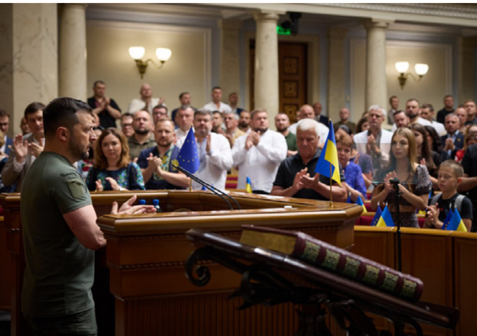
Volodymyr Zelenski duke iu drejtuar Verkhovna Rada me rastin e Ditës së Kushtetutës së Ukrainës - 28 qershor 2023

Patriarku Kirill hapur mbështet pushtimin ushtarak rus të Ukrainës. Siç kemi shkruar tashmë, Zelenski mbron Ukrainën kundër propagandës ruse në kisha.