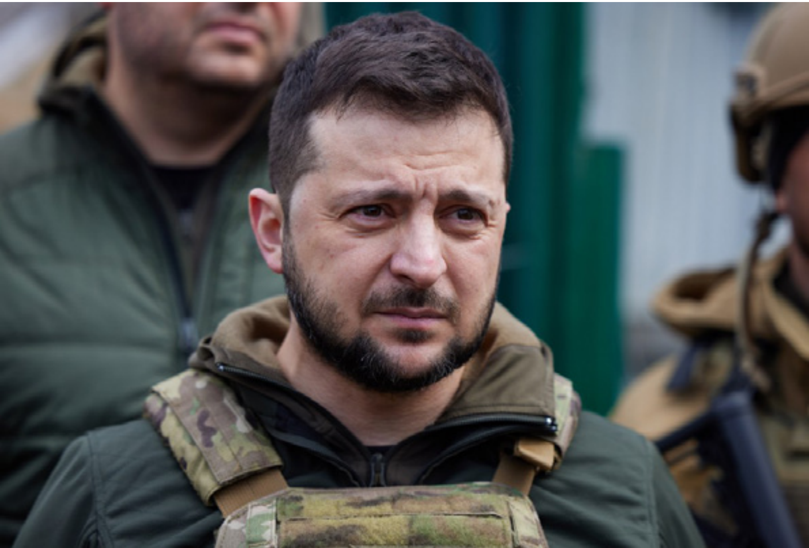
Foto: Presidenti ukrainas Volodimir Zelenski gjatë vizitë në fushën e betejës afër rajonit të Kievit.

Për të gjitha faktet e mësipërme, ne e vlerësojmë postimin që po shqyrtojmë si të pavërtetë . Elitat perëndimore nuk janë gati të shijojnë përshkallëzimin e luftës së përgatitur prej kohësh. Ata nuk e kanë përgatitur luftën, as nuk e shijojnë përshkallëzimin e saj, sepse do të thotë jetë të humbura, qytete të shkatërruara, por në kuptimin e gjeo strategjisë në përgjithësi, përshkallëzimi nuk është i favorshëm për askënd, sepse mund të çojë në përhapjen e luftës në Evropë. Narrativa se lufta bëhet nga vëllai kundër vëllait, pra fiset sllave që janë të përçara dhe të kontrolluara, të drejtuara nga Perëndimi ndaj njëri tjetrit, është e pabazë në një situatë kur një shtet hyn në territorin e një shteti tjetër sovran dhe demokratik dhe fillon ta bombardojë atë.