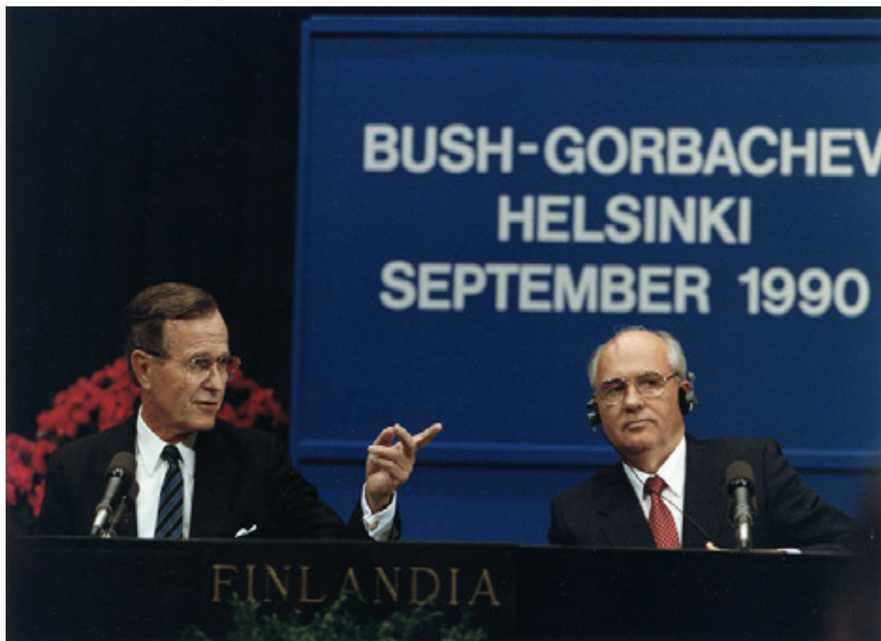
Bush-Gorbashov, Helsinki 1990.

Shkruan: Ekipi i Vërtetmatësit, 05.10.2023