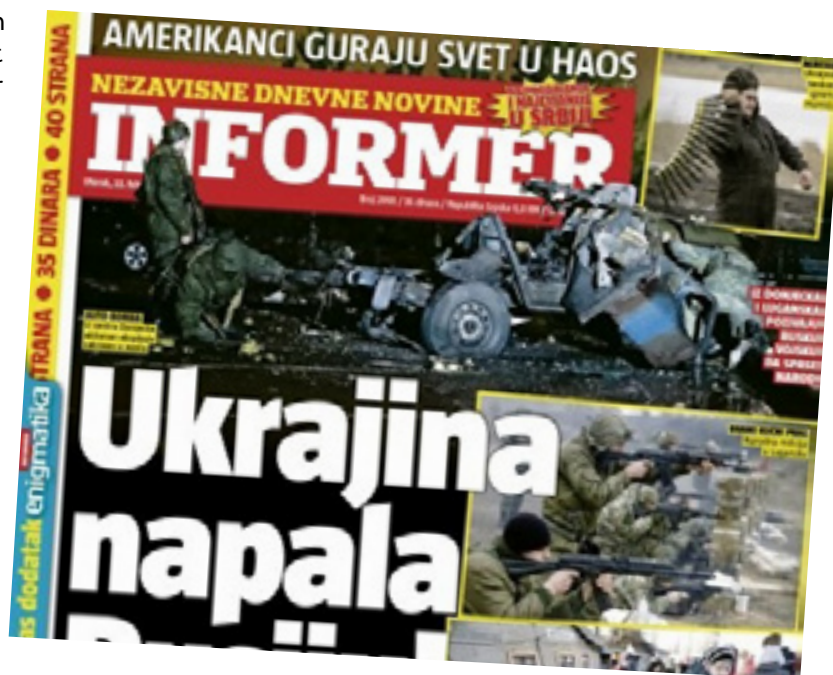
Një nga titujt e “Informer”