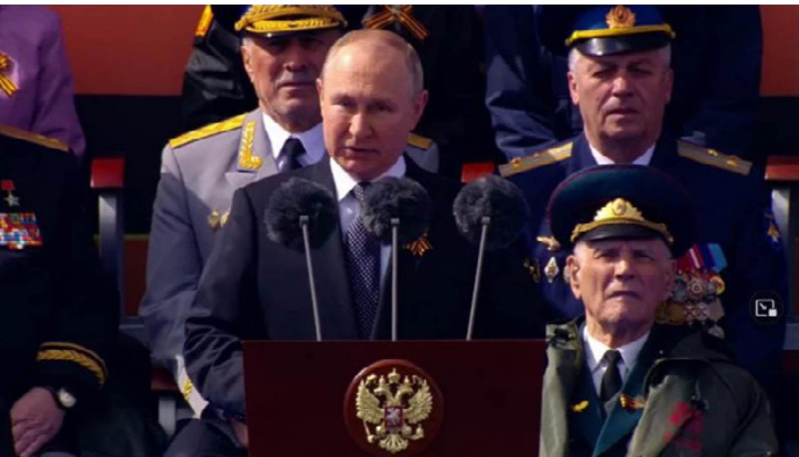
nga Parada e Fitores në Moskë, 05.09.2022

Ajo që mund të merret si konstante në gjithë këtë “luftë ndërkulturore” të bazuar në dezinformata, lajme të rreme dhe teori konspirative, është se shumë shpesh Rusia ndërhyr në anën e tradicionalistëve dhe mbështet të djathtët radikalë në vendet perëndimore. Transmetuesit rusë të financuar nga shteti si RT dhe Sputnik kanë transmetuar prej kohësh në vendet liberale perëndimore dhe propaganda e tyre që synon minimin e besimit në sistemet perëndimore shpesh është ndarë nga grupet e krahut të djathtë. Franca ekspozoi kohët e fundit një fushatë të gjerë ruse që synonte minimin e mbështetjes perëndimore për Ukrainën, raportoi agjencia shtetërore franceze Viginum, e cila synon të luftojë ndërhyrjet dixhitale të huaja. Lufta në Ukrainë ka intensifikuar ndjeshëm dezinformatat dhe lajmet e rreme që po përhapen në Perëndim dhe veçanërisht në Ballkan, e që burojnë nga “kuzhinat ruse”.