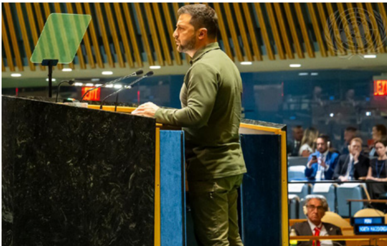
Presidenti i Ukrainës gjatë fjalimit të tij në seancën e 78-të të Asambleja e Përgjithshme e Kombeve të Bashkuara, 19 shtator 2023

Përkatësisht, një nga mediat ukrainase, logoja e së cilës përdoret edhe në videon e postimit që po rishikojmë, ka publikuar një përgënjeshttrim me titullin “Njoftim nga Edini Novy, për maratonën në lidhje me informacionin e rremë se ka pasur ndryshime në transmetimin e drejtpërdrejtë i fjalimit të Presidentit të Ukrainës në OKB”.